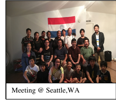
Meeting @ Seattle,WA