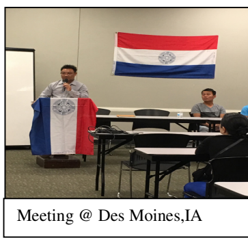
Meeting @ Des Moines,IA