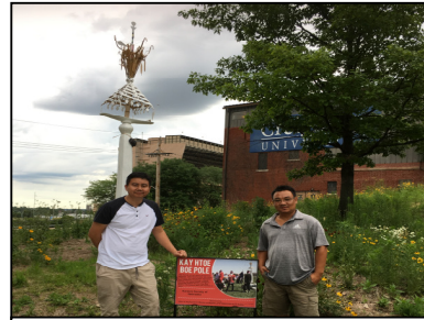
Meeting @ St.Paul, MN