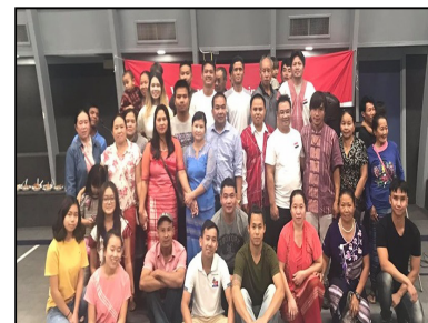
@ Phoenix, AZ