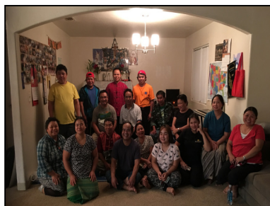
@ Tucson, AZ