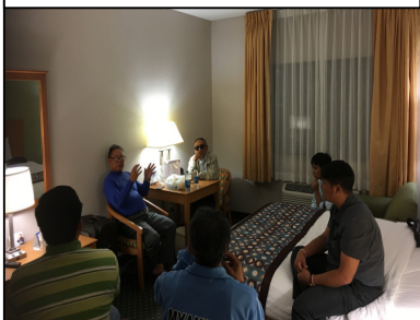
Chairperson's pre-meeting, IA