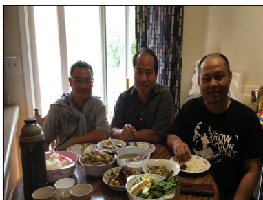
Meeting @ St.Paul, MN