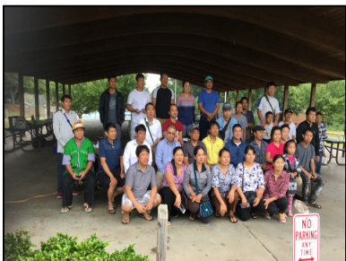
Meeting @ Western Salem, NC