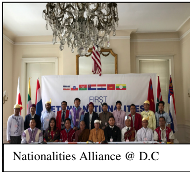
Nationalities Alliance @ D.C