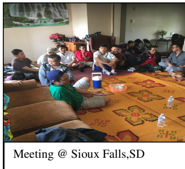
Meeting @ Sioux Falls,SD