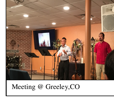
Meeting @ Greeley,CO