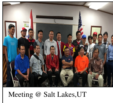
Meeting @ Salt Lakes,UT