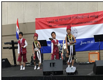
Karenni National Day @ IA