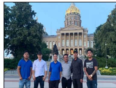
@ Des Moines, IA