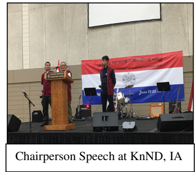
Chairperson Speech at KnND, IA