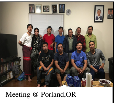
Meeting @ Portland,OR