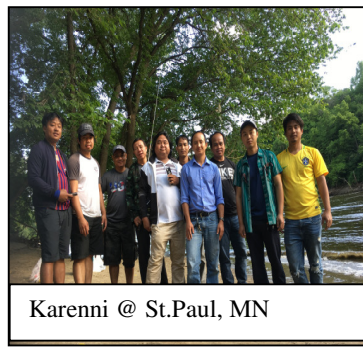
Karenni @ St.Paul, MN