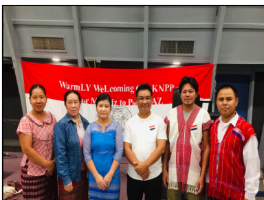
@ Phoenix, AZ